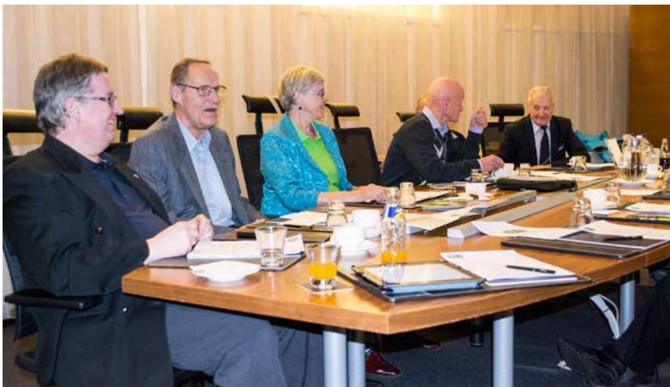
Armas Valste Yleisurheiluklubin syyskokous järjestettiin 17.11. Kalastajatorpalla Helsingissä.